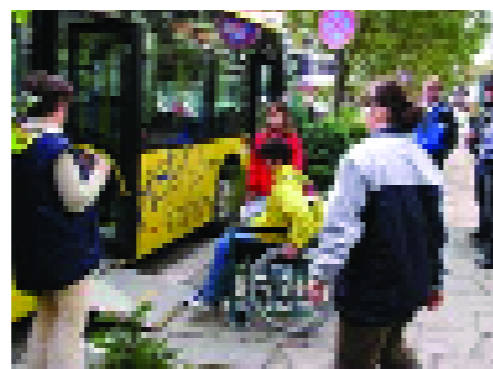
EMW nella Repubblica Ceca.

Seven days devoted to problems connected to sustain-