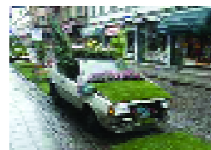
EMW a Lund, Svezia.