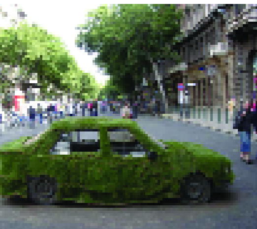
European Mobility Week a Budapest, Ungheria

European Mobility Week in Budapest, Hungary