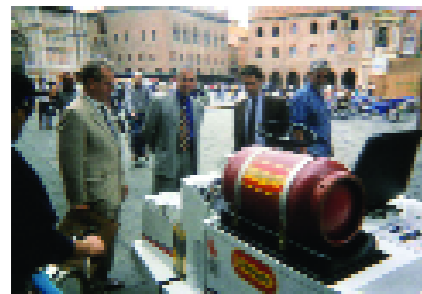
Il Consorzio Ecogas è un pioniere del 22 settembre. 1999, GPL day: qui sopra, Bologna, spazzolatrice Dulevo con impianto GPL, a destra, Roma, Mogol prova uno scooter a GPL.

European Mobility Week in Budapest, Hungary