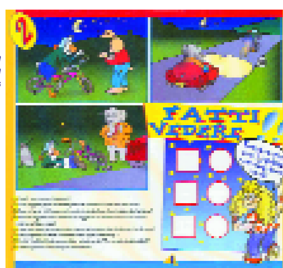
Bimbinstrada The handbook of the prevention of road accidents: cover and some pictures

the Brescia-based Associazione Stradamica (road safety association) are in fact promoting a publishing initiative targeting